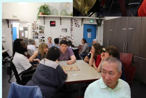
L'après-midi jeux, découverte chez le GEM Versailles Yvelines