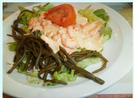
Le fameux plat