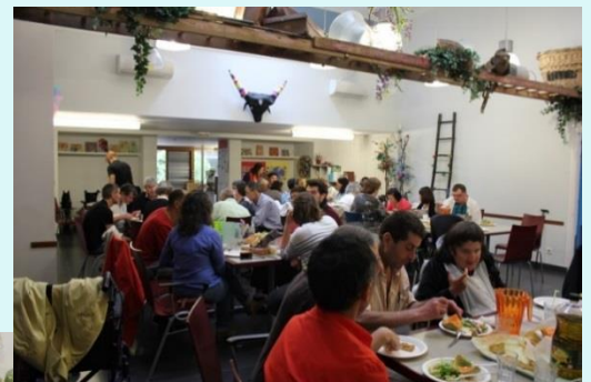
Le temps du repas