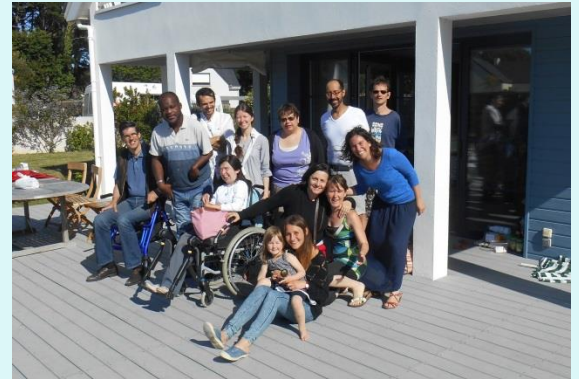
Mini-séjour du CAP au bord de la mer à Quimiac (44), mi-juin