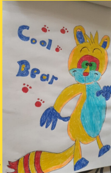
Dessin d'Angelica, du GEM Versailles Yvelines