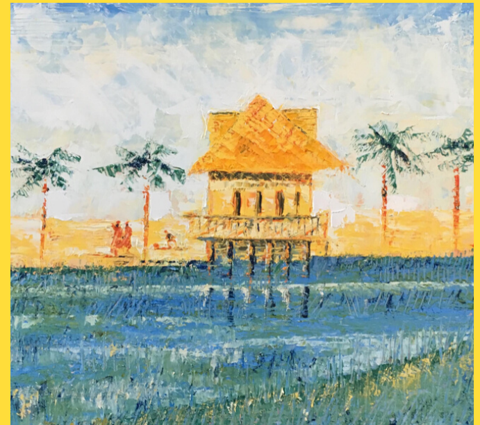
du GEM Versailles Yvelines