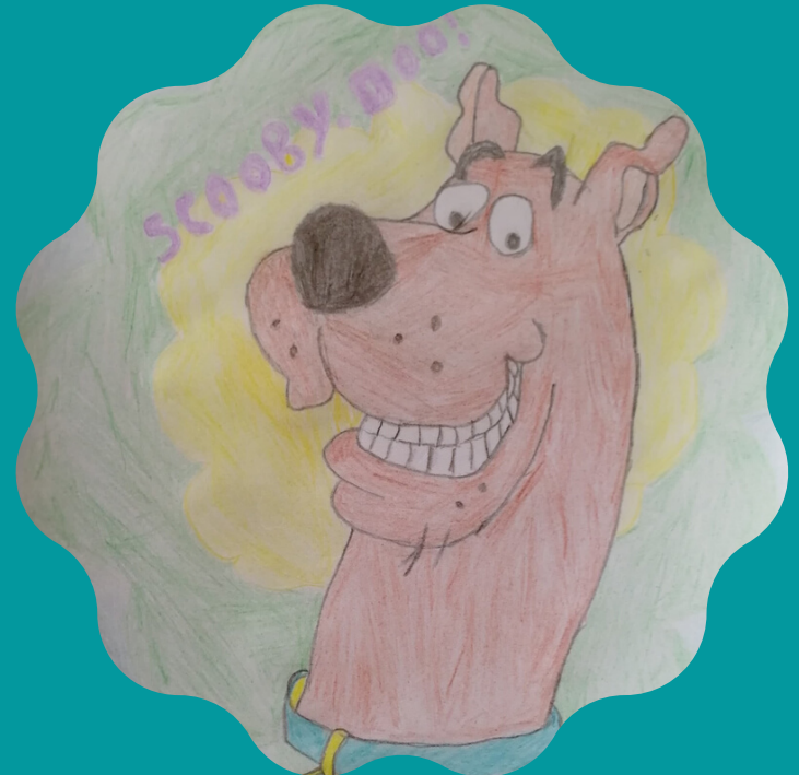
Dessin de Christophe, du GEM Versailles Yvelines