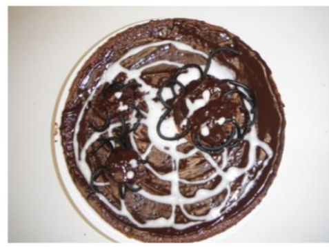
Le gâteau aux araignées, recette détaillée page 3