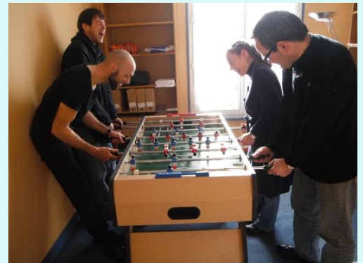
L'espace détente du GEM Versailles Yvelines