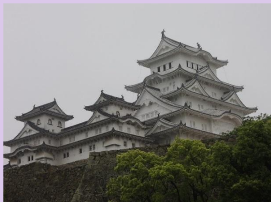
LE CHATEAU DE HIMEJI