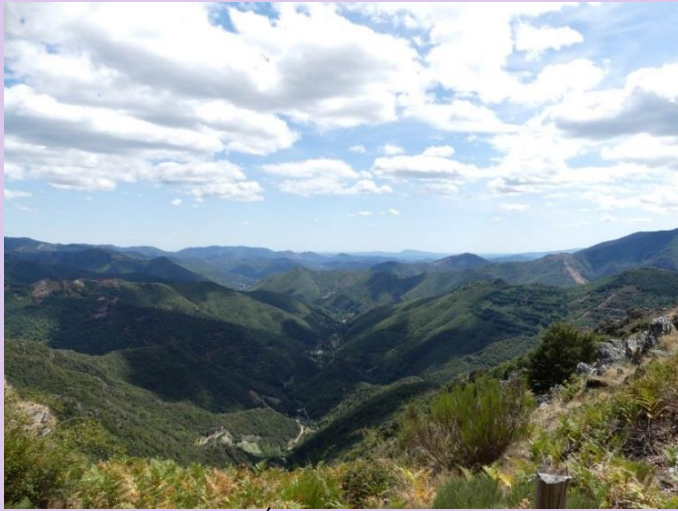
LES MONTAGNES DES CÉVENNES