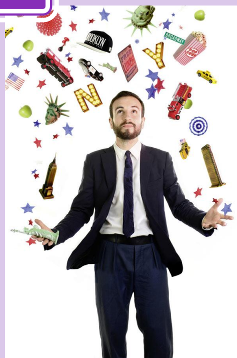
ACADÉMIE FRATELLINI