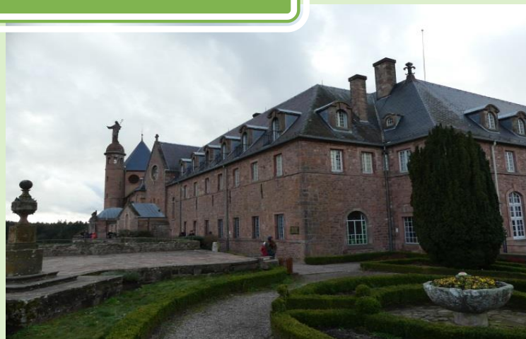
Couvent de l'abbaye de Hohenbourg