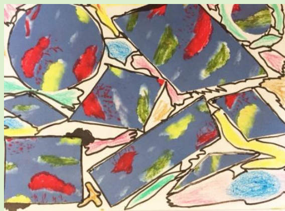
Œuvre réalisée par le GEM Versailles Yvelines