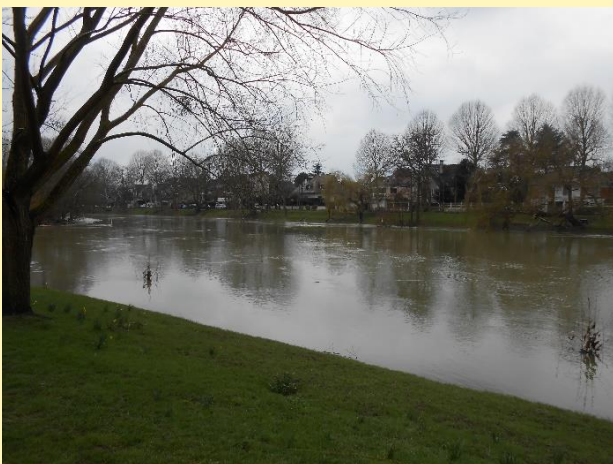
LES BORDS DE MARNE