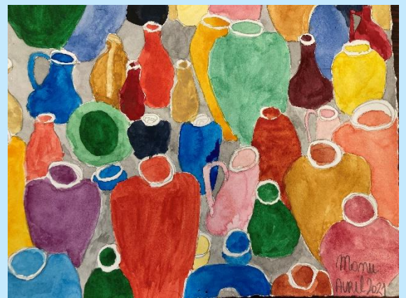
CEUVRE D'EMMANUELLE