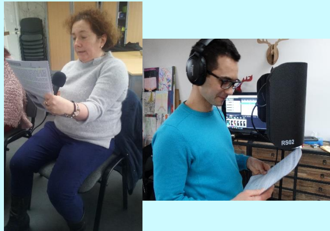
ENREGISTREMENT AUDIO MOTS EN TETE PHOTOS © GEM CHEZ GODOT