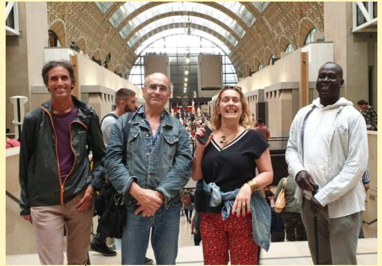
SORTIE AU MUSÉE D'ORSAY